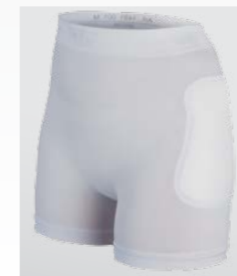
Fest integrierte Protektoren bei Demenz