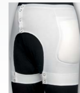
Anleghose bei Inkontinenzproblemen