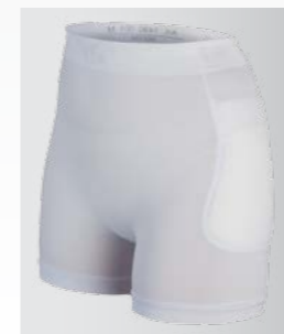
Wechselbare Protektoren für einfache Wäsche