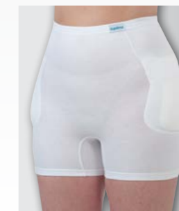
Slip mit Wäscheschutz bei Inkontinenz