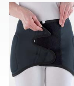
Hüftschutzgürtel für Reha und privaten Bereich