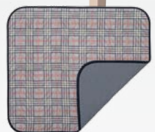
Sitzauflage mit Anti-Rutsch Beschichtung