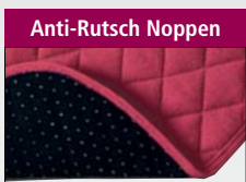
Sitzauflage mit Noppen