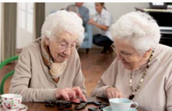
in der Pflegeeinrichtung