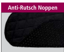
Sitzauflage XL mit Noppen