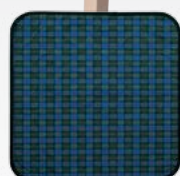
Sitzauflage karo blau-grün