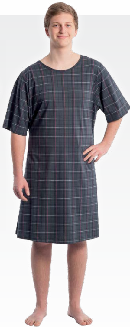
Abb.: Karo anthrazit