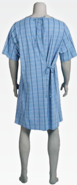
Abb.: Karo blau