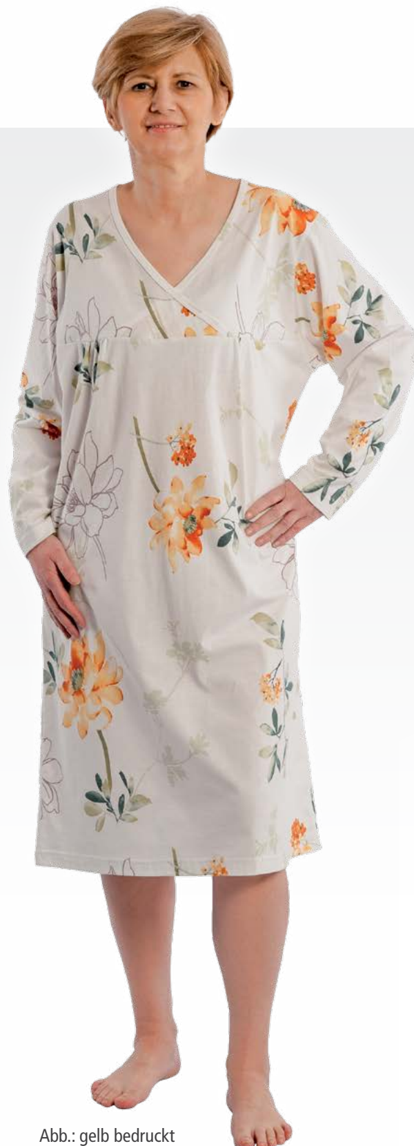
Abb.: gelb bedruckt