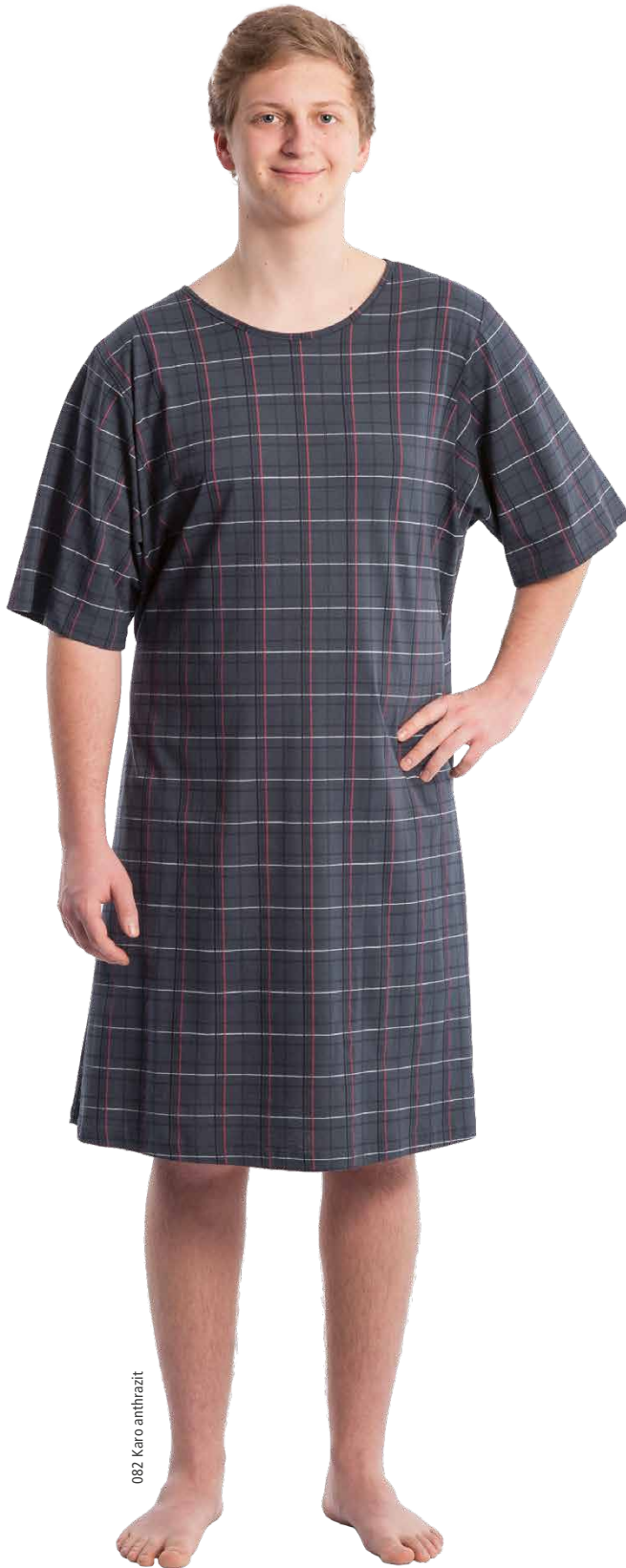
082 Karo anthrazit