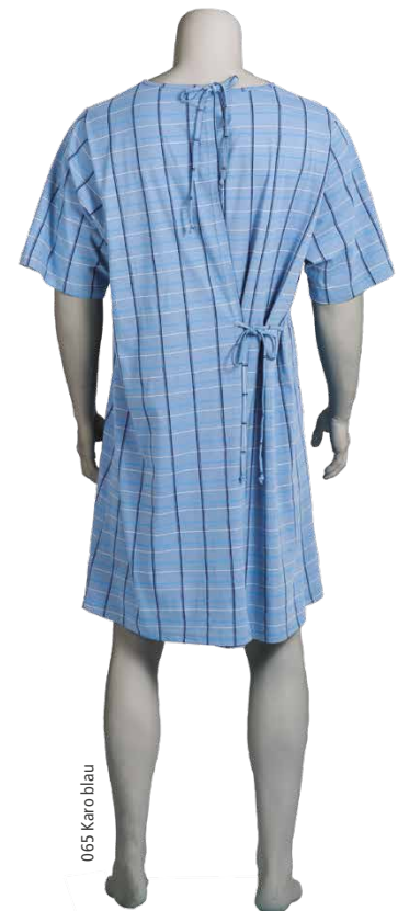
065 Karo blau