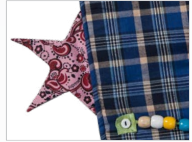
Element mit eingearbeiteter Knisterfolie weckt die Neugier beim ertasten.