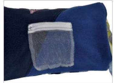
Transparente Tasche zum Einstecken persönlicher Fotos oder anderer kleiner Erinnerungen des Patienten.