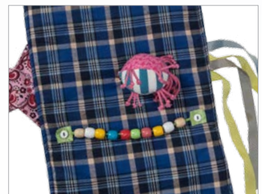
Muff kann aufgeknöpft auch als Nesteldecke verwendet werden.