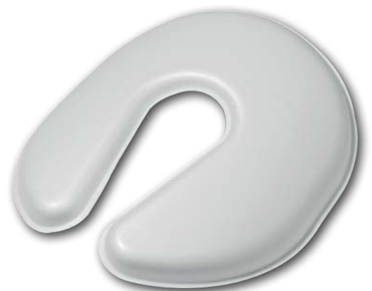
Classic - Protpektor