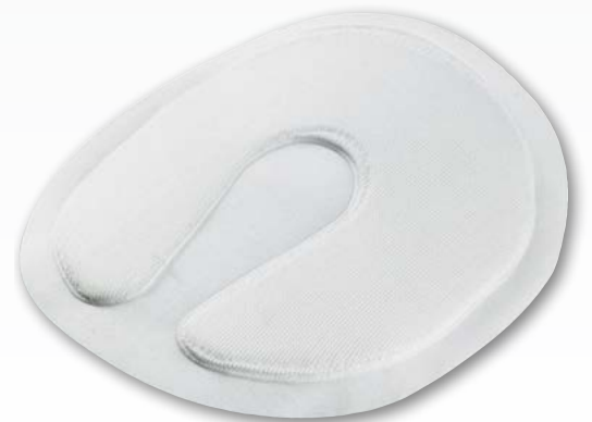
AirX - Protpektor